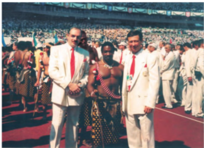
17 сентября 1988 года. Сеул. С Геннадием Паршинем на церемонии открытия Игр XXIV Олимпиады.