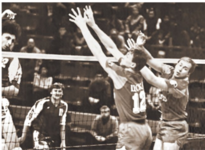
Поединки ленинградского «Автомобилиста» и ЦСКА – были всегда событием в чемпионатах СССР.