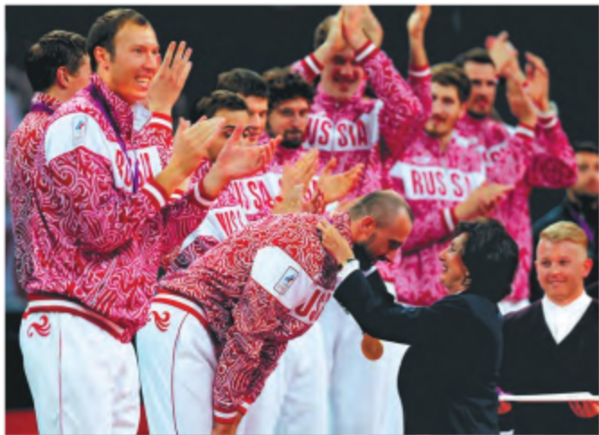
12 августа 2012 года. Награждение сборной России – победителей Игр XXX Олимпиады. Медаль вручает олимпийская чемпионка Ирена Шедивьска (Польша).