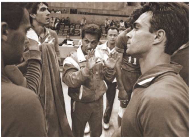
Хулио Веласко и его первая сборная - итальянская.