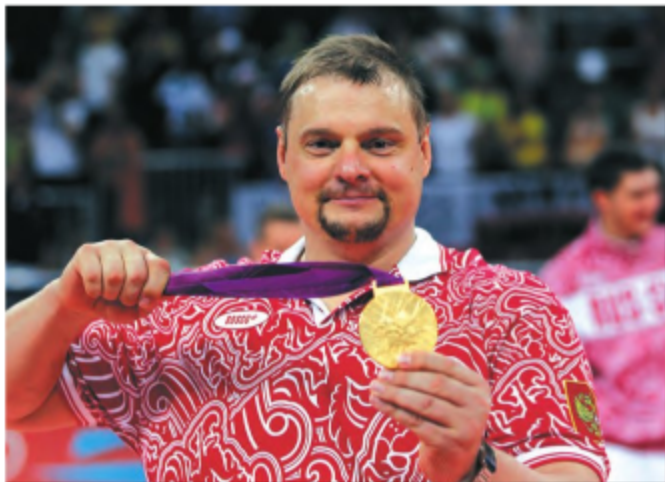
12 августа 2012 года. Владимир Алекно с золотой олимпийской медалью.