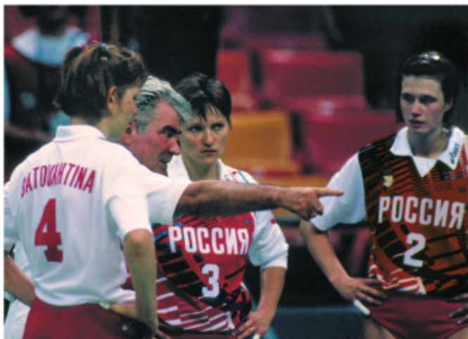
Николай Картоль с волейболистками сборной России.