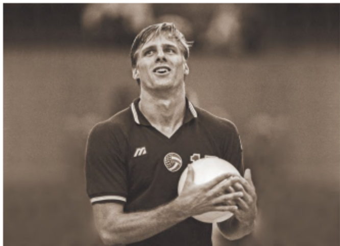
Карч Кирилл, капитан сборной США.