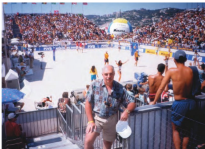
Июль 1999 года. Марсель. Чемпионат мира по пляжному волейболу.