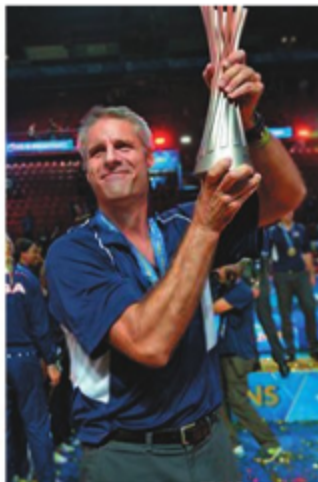
Карч Кирай, главный тренер женской сборной США.