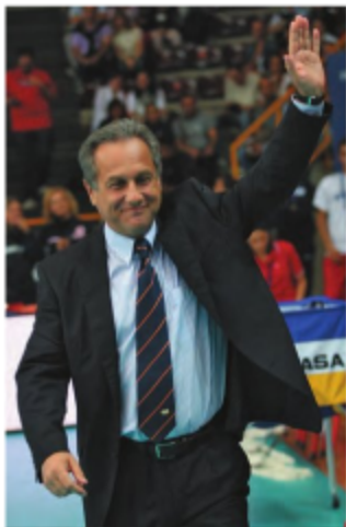
Хулио Веласко, главный тренер сборной Испании.