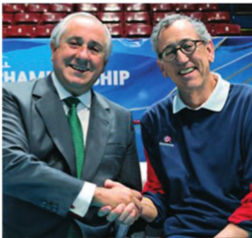
Президент ФИББ Ари Граса (Бразилия) и Даг Бил (США).