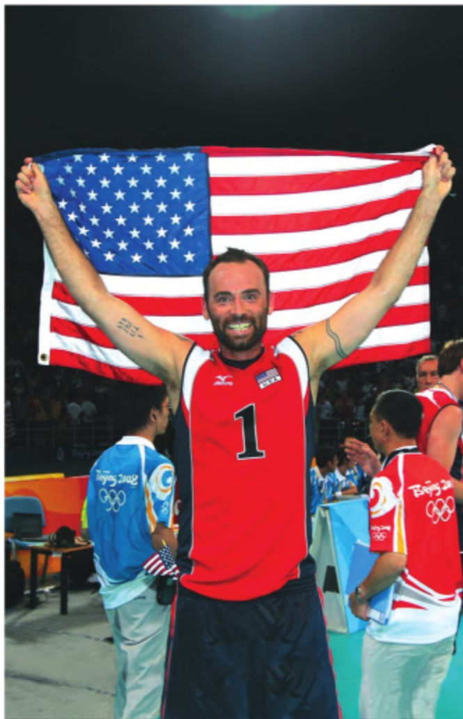
Лиуй Бол, олимпийский чемпион Пекина-2008.