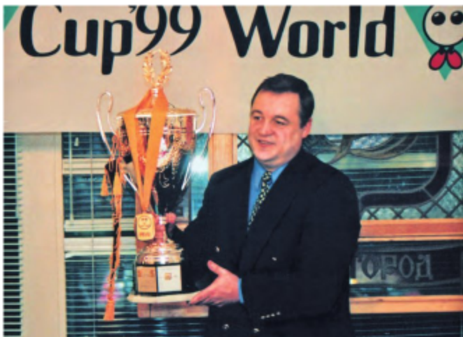
Геннадий Шинтулин после победы в Кубке мира 1999 года.